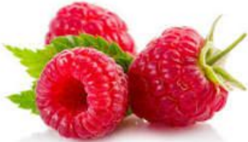
La Framboise **