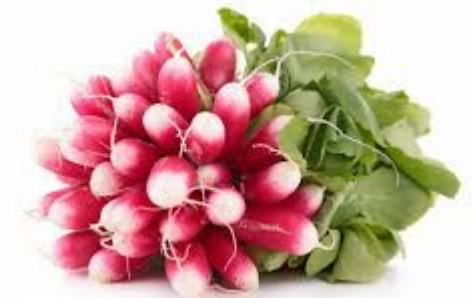
Les Radis roses